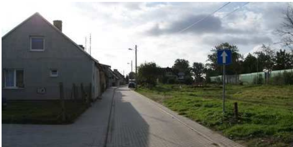
Bystra, ul. Długa

W roku 2011 została wyremontowana jedna z głównych ulic miejscowości - ul. Długa, powstało nowe rondo, na ulicy Krótkiej powstał ciąg pieszo - jezdny.