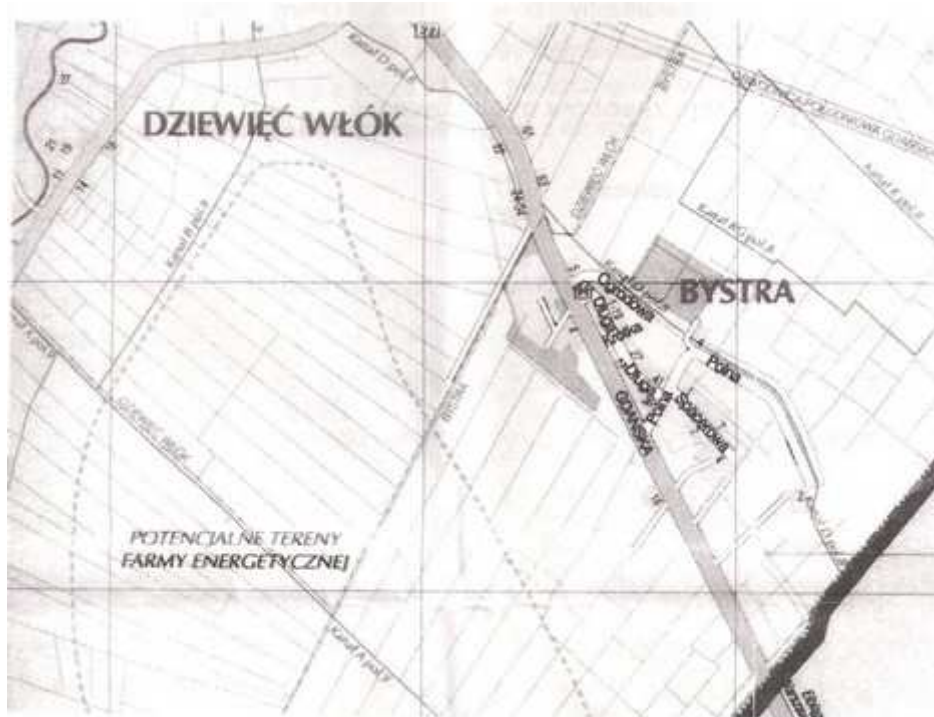
Układ przestrzenny Bystrej

Zabudowa przestrzenna Bystrej charakteryzuje się brakiem centralnego układu. Osią miejscowości jest droga krajowa nr 7 z Gdańska do Warszawy. Odległość z Bystrej do Pruszcza Gdańskiego wynosi ok. 11 km, a do centrum Gdańska ok. 12 km. Zabudowa miejscowości składa się z domów jedno i dwurodzinnych, bloków mieszkalnych.