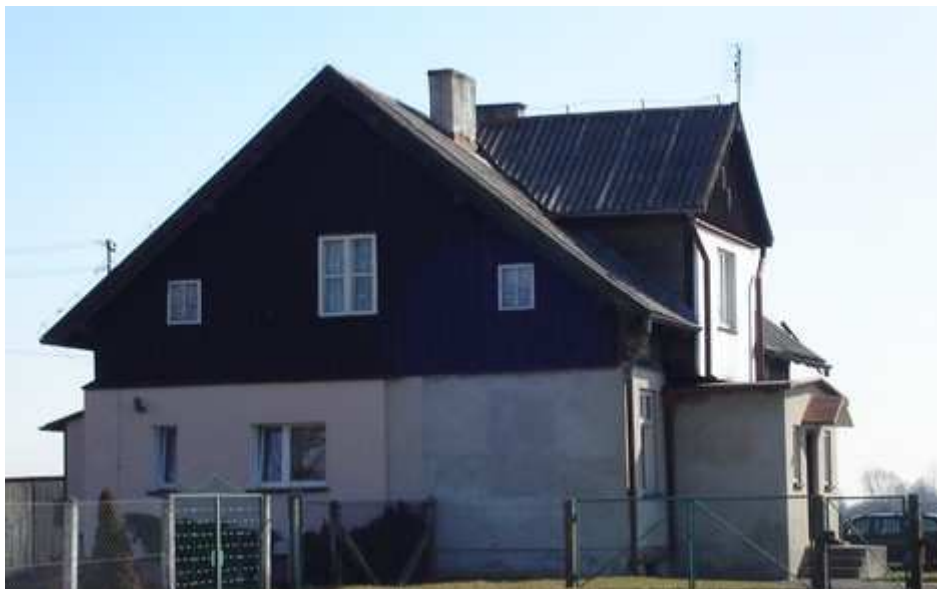
Budynek przy ul. Polnej 4

W gminnej ewidencji zabytków znajdują się 1 obiekt z Bystrej znajdujący się przy ul. Polnej 4, pochodzący z końca XIX w. Na szczególną uwagę w tym obiekcie zasługują szalowane pionowo drewniane szczyty z ażurową dekoracją.